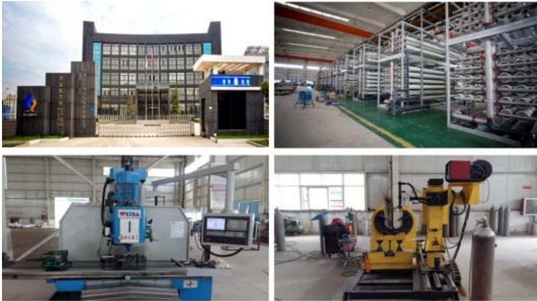
倍杰特生产制造基地